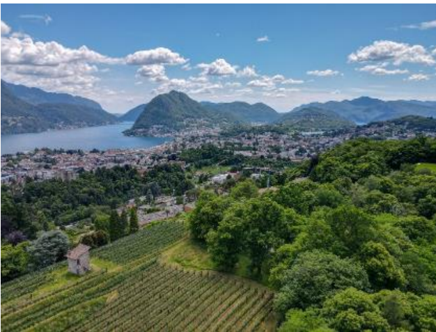
Der sagenhafte Ausblick über den Lago di Lugano, hinein in die malerischen Seitentäler.

An der «Fiera di San Martino» wird Mendrisio jährlich um den Martinstag (11. November) herum zum Treffpunkt für die ganze Region. Und dies bereits seit über 400 Jahren. Der traditionelle Anlass geht auf das bäuerliche Arbeitsjahr zurück. Das alte italienische Sprichwort «Per San Martino ogni botte è vino» - wörtlich übersetzt «Für Sankt Martin ist jedes Fass Wein» - lässt sich in etwa so interpretieren: Bis zum Tag des heiligen Martins waren die Arbeiten auf den Feldern beendet und die Trauben geerntet. In den Fässern lagerte der junge Wein und gleichzeitig liefen die Pachtverträge der Bauern aus, der Zins musste bezahlt werden. Wenn dann Mitte November die neuen Verträge unter Dach und Fach waren, wurde gefeiert.