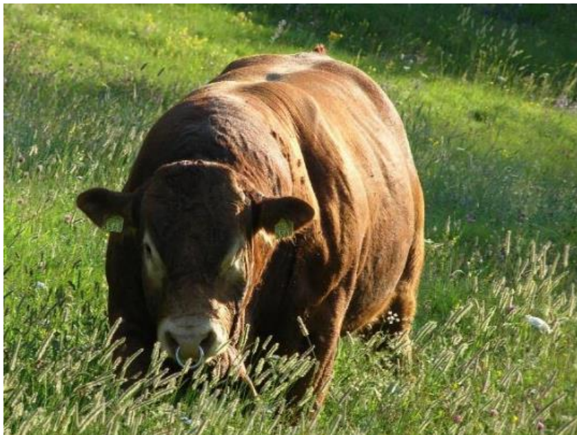
Stiere der Rasse Limousin sind in der Schweiz sehr verbreitet.

Ein ausgewachsener Stier ist ein beeindruckendes Kraftpaket!